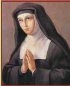
Heilige Margareta Maria Alacoque 1647 - 1690

Die 12 Verheißungen an die HI. Margareta, als ihr während des Gebetes vor dem Tabernakel Jesus erschien und um öffentliche Verehrung Seines Herzens bat, aus Liebe zu Seiner Liebe und zur Sühne. All jenen, die das Herz Jesu andächtig verehren, versprach Er: