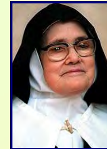
Lucia dos Santos Sr. Maria vom Unbefleckten Herzen 1907 - 2005

»Es ist mein sehnlichster Wunsch, dass die Verehrung und die Andacht zum Unbefleckten Herzen Mariens verbreitet wird, weil dieses liebende Herz der Magnet ist, der die Seelen zu mir hinzieht, der Feuerherd, der die Strahlen meines Lichtes und meiner Liebe über die ganze Erde hin aussendet, und die unversiegbare Quelle, welche die lebendigen Wasser meines Erbarmens auf die Erde herabströmen lässt.«